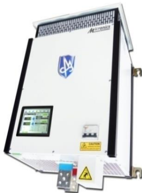
Exemple : CPR +/- 500 A +/-50 V

Modèle Mural L : 450 mm x H : 620 mm x P : 400 mm