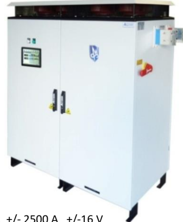
Exemple : CPR +/- 2500 A +/-16 V

Modèle Armoire L : 1200 mm x H : 1400 mm x P : 600 mm