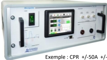
Exemple : CPR +/-50A +/-20 V

Modèle de Table L : 530 mm x H : 220 mm x P : 450 mm